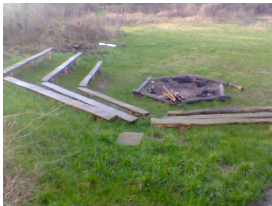
Båtpladsen ved Spejd Niløse