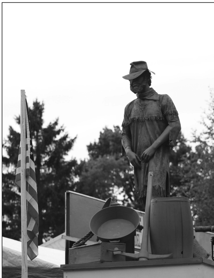
Statuen af vores afgangende borgmester, den grandiose Frank McGurre